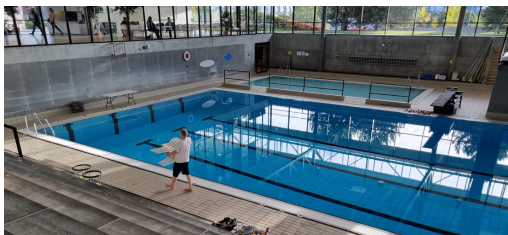
Bellahøj lördag morgon innan omgången startade

Första omgången av Underwater Rugby League har spelats i Bellahøj, København helgen 8-9 oktober. Har ni missat det så finns det en massa matchminuter att titta på. Tills vidare ligger allt på DKBs YouTube sida.